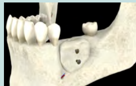
Mise en place de la greffe