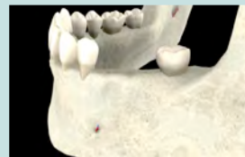
Incorporation de la greffe